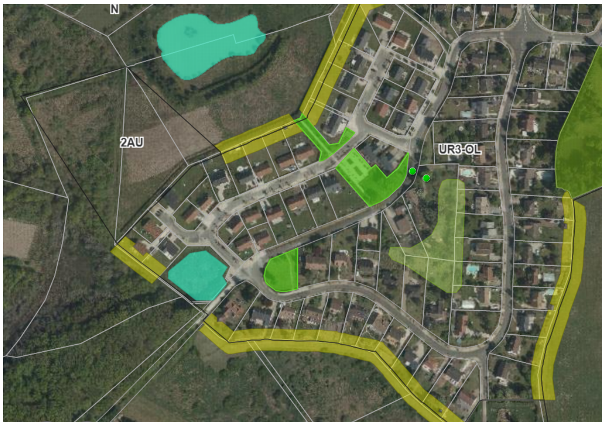
Figure 1 : carte du PLUM et de la vue aérienne de la zone 2AU du Clos du Chêne à Chanteau