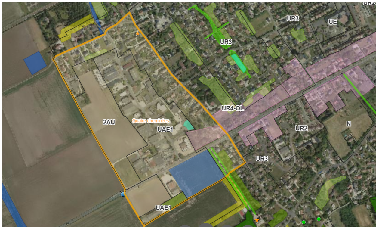
Figure 3 : carte du PLUM et de la vue aérienne de la zone 2AU du pôle d'activités des Quatre cheminées à La Chapelle-Saint-Mesmin