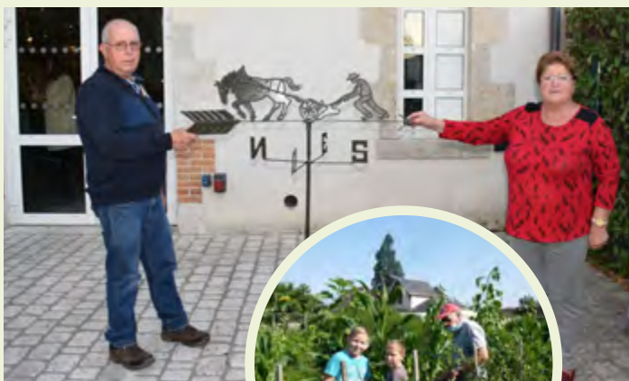
Le jardin des écoliers rouvrira début avril.

La girouette offerte par la municipalité au Jardin des écoliers a été fixée sur le hangar du Jardin des écoliers, le 17 janvier dernier.