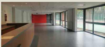
Espace convivialité rue Creuse