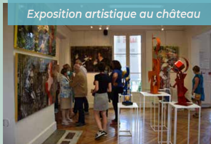
Exposition artistique au château