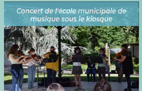
Concert de l'école municipale de musique sous le kiosque