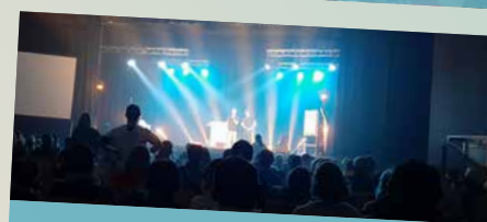
Spectacle de magie avec Donovan