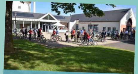
Les échappées à vélo