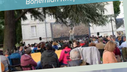
Evasion Jeunesse Journée à Disneyland Paris