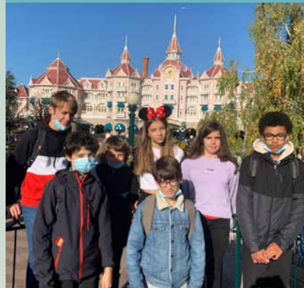
Spectacle La revanche des Manhattan Sisters