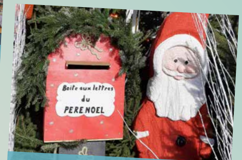
Boîte aux lettres du Père Noël