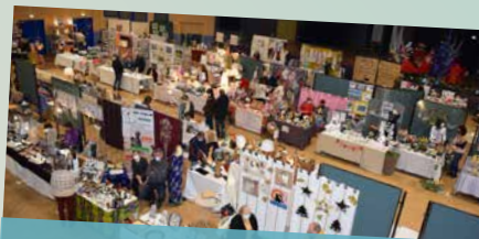
Noël des artisans d'art