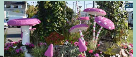
Octobre Rose à Saint-Jean-le-Blanc