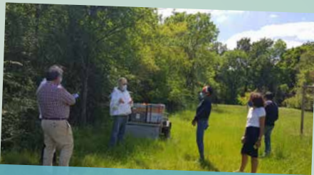
Pose des premières ruches à l'Arboretum