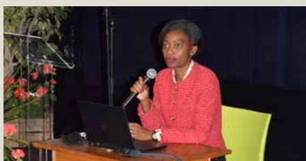
Conférence Perturbateurs Endocriniens et campagne zéro phtalate