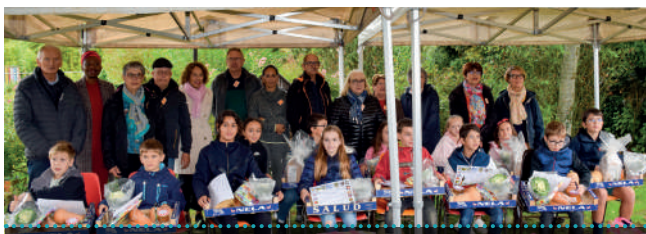
REMISE DE RÉCOMPENSES JARDIN DES ÉCOLIERS Octobre 2022