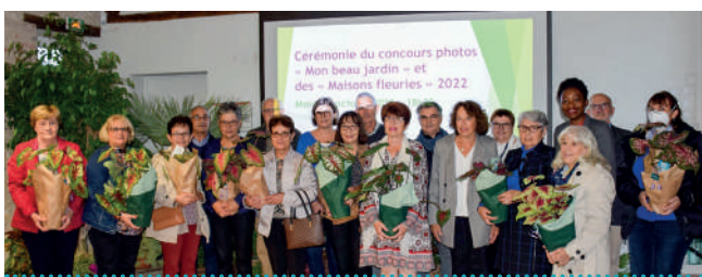
RÉCOMPENSES DES MAISONS FLEURIES ET DU CONCOURS PHOTOS « MON BEAU JARDIN » Octobre 2022