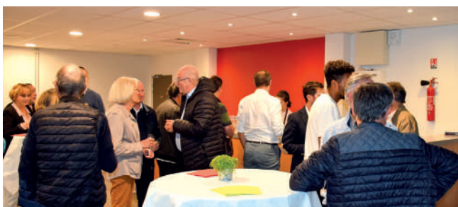
INAUGURATION DE LA SALLE DE CONVIVALITÉ Octobre 2022