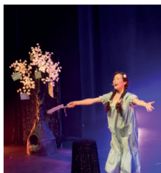
Spectacle musical Au lit Molie ! | Octobre 2022