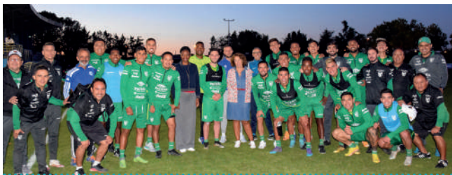
L'ÉQUIPE DE FOOTBALL BOLIVIENNE à Saint-Jean-le-Blanc | Septembre 2022