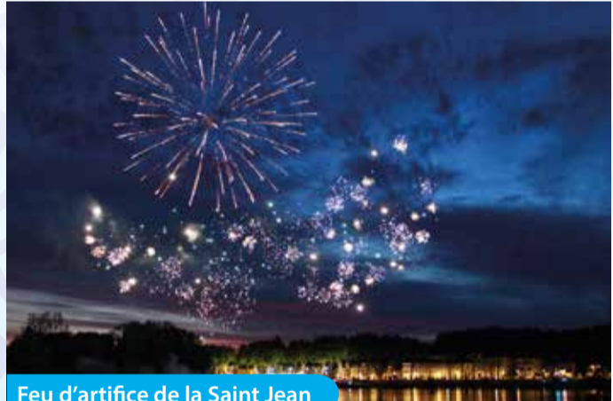
Feu d'artifice de la Saint Jean