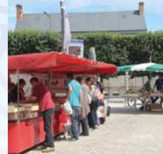
Marché Place de l'église