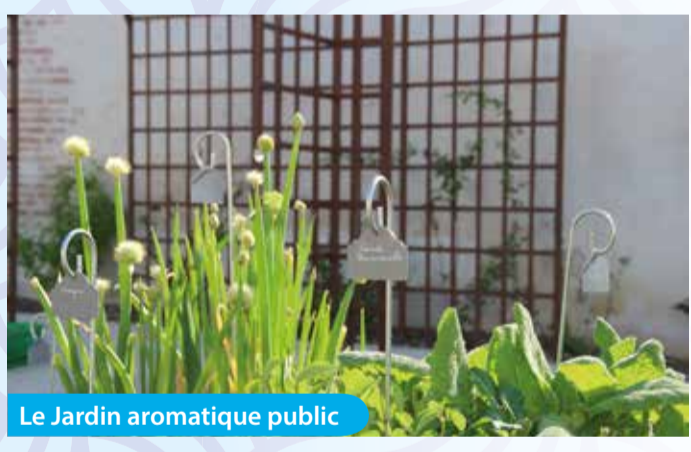
Le Jardin aromatique public