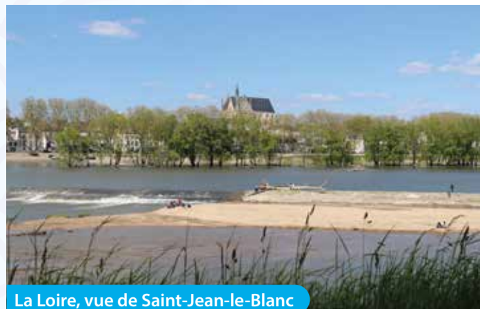
La Loire, vue de Saint-Jean-le-Blanc

Située au cœur du Val de Loire, lequel est classé au patrimoine mondial de l'UNESCO, la ville de Saint-Jean-le-Blanc – dont l'existence remonte à plus d'un millénaire – bénéficie d'une situation géographique privilégiée avec la ville d'Orléans, capitale régionale, puisqu'elle en est limitrophe, ainsi que d'un atout maître : la Loire, « dernier fleuve sauvage d'Europe ». Sans compter le Parc de Loire, et sa base de loisirs de l'Île Charlemagne, avec un plan d'eau de 28 ha et un site boisé aménagé de 42 ha, située sur son domaine. Pêche, canoë, jogging, balade à vélo, baignade, jeux d'enfants, etc... chacun peut, sans contrainte, s'adonner à ses loisirs préférés dans les différents cadres naturels qu'offre la ville.