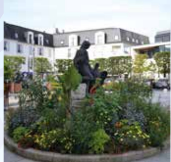
La Place de l'église