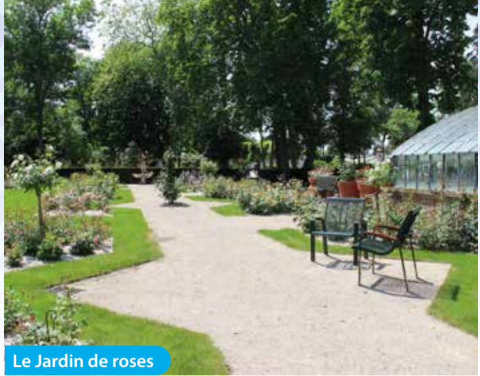
Le Jardin de roses