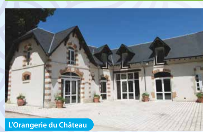
L'Orangerie du Château