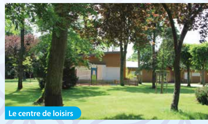
Le centre de loisirs