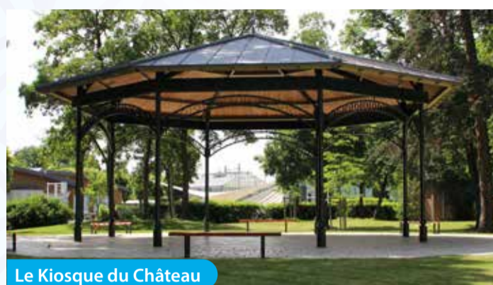
Le Kiosque du Château

Située au cœur du Val de Loire, lequel est classé au patrimoine mondial de l'UNESCO, la ville de Saint-Jean-le-Blanc – dont l'existence remonte à plus d'un millénaire – bénéficie d'une situation géographique privilégiée avec la ville d'Orléans, capitale régionale, puisqu'elle en est limitrophe, ainsi que d'un atout maître : la Loire, « dernier fleuve sauvage d'Europe ». Sans compter le Parc de Loire, et sa base de loisirs de l'Île Charlemagne, avec un plan d'eau de 28 ha et un site boisé aménagé de 42 ha, située sur son domaine. Pêche, canoë, jogging, balade à vélo, baignade, jeux d'enfants, etc... chacun peut, sans contrainte, s'adonner à ses loisirs préférés dans les différents cadres naturels qu'offre la ville.