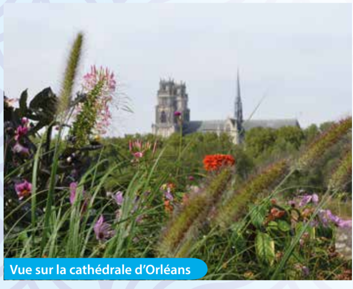
Vue sur la cathédrale d'Orléans